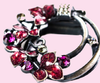
スカーフクリップ